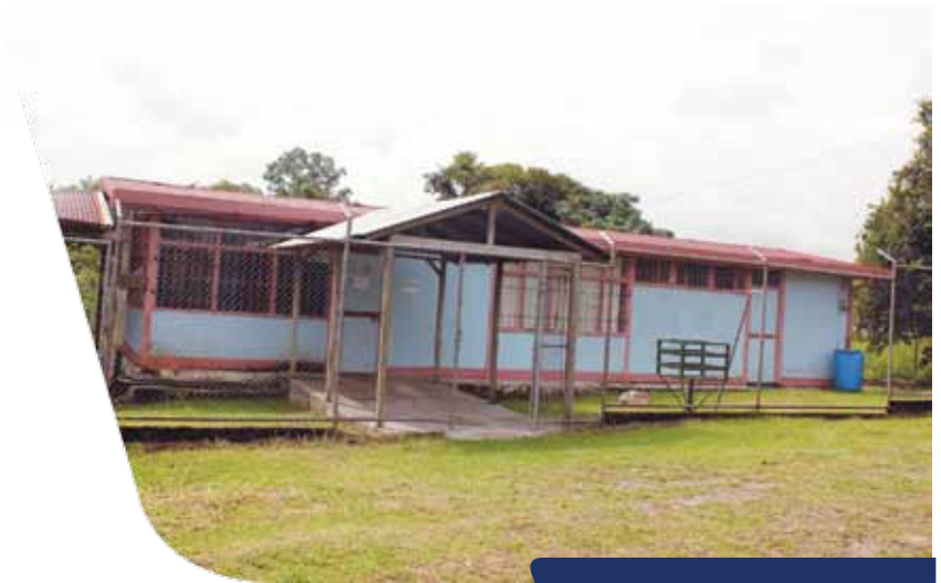
EBAIS de Cubujuquí.

Sin duda, poner en marcha estos siete proyectos, acerca a la comunidad de Cubujuquí a la meta de cumplir los objetivos trazados en el Plan de Desarrollo 20 20, por ello la Asociación de Desarrollo de la comunidad apuesta a seguir trabajando en equipo para que en el año 2020 puedan con satisfacción disfrutar de la nueva comunidad de Cubujuquí que han construido.