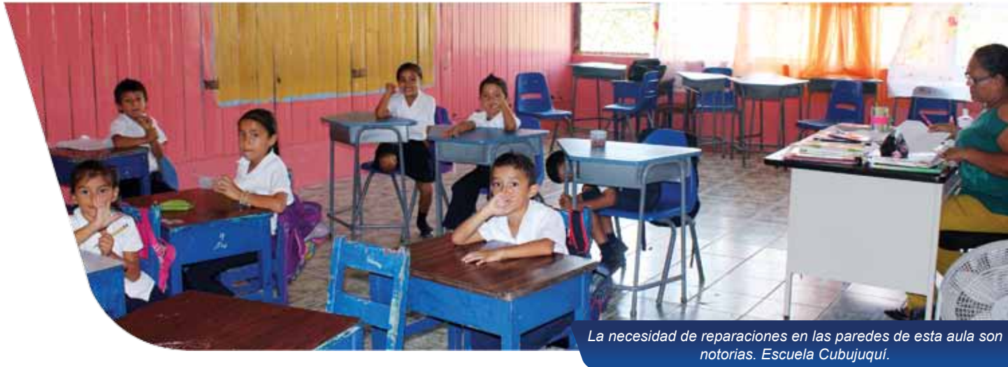
La necesidad de reparaciones en las paredes de esta aula son notorias. Escuela Cubujuquí.

Tomando en cuenta la importancia que tiene contar con condiciones óptimas para el desarrollo educativo, como una forma de crear oportunidades y mejorar el futuro de una comunidad, la Cooperativa decide invertir en aquellos proyectos que busquen mejorar la infraestructura, tanto de la escuela de Cubujuquí, como de la Telesecundaria. Para esto donará ₡4.000.000 (cuatro millones de colones), que serán distribuidos entre varios proyectos presentados por ambas instituciones.