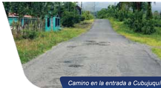
Camino en la entrada a Cubujuquí que será bacheado.

Se estima que en el mes de agosto queden finalizados estos dos kilómetros de asfaltado.