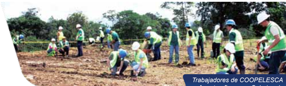
Trabajadores de COOPELESCA reforestan fincas en Cubujuquí.

En este proceso de siembra han colaborado los estudiantes de la escuela de Cubujuquí, docentes, padres de familia de la comunidad, estudiantes del Centro Cultural Norteamericano, funcionarios de diferentes departamentos de COOPELESCA y por supuesto los colaboradores del vivero y del departamento de Gestión Ambiental y Social.