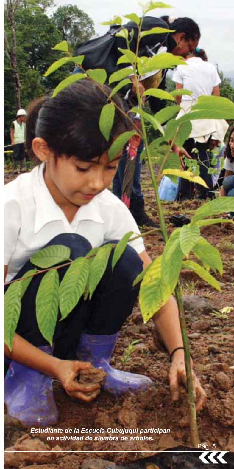
Estudiante de la Escuela Cubujuquí participan en actividad de siembra de árboles.