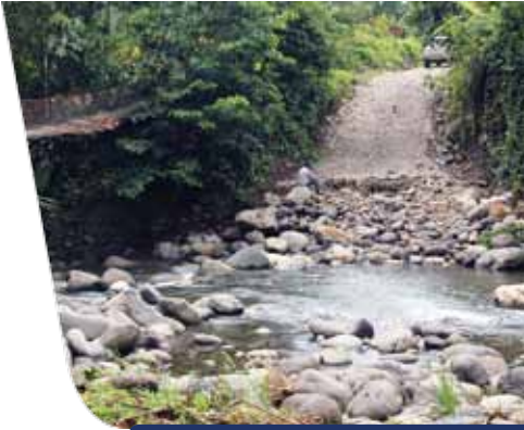
Área donde estará ubicado el nuevo puente que unirá Sector A y B.

Desde hace mucho tiempo, los vecinos de Cubujuquí sueñan con acortar la distancia entre los dos sectores de su comunidad mediante la habilitación de un puente que reduce significativamente la distancia entre el sector A y B; actualmente el recorrido que una persona debe hacer de un sector a otro es cercano a 8 kilómetros y con la colocación del puente, la distancia se acortaría a menos de un kilómetro.