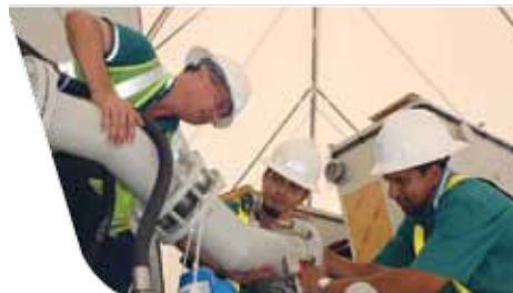
Trabajadores responsables del montaje electromecánico revisan equipos provenientes de la India.

Dentro del proceso constructivo del proyecto, el montaje del equipo electromecánico es uno de los trabajos clave para su éxito; precisamente el pasado 23 de abril llegó a Cubujuquí todo el equipo de generación con que contará el P.H. Cubujuquí, proveniente de la empresa brasileña Voith Hydro, sede la India.