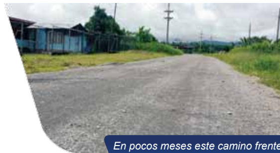
En pocos meses este camino frente al EBAIS lucirá asfaltado.