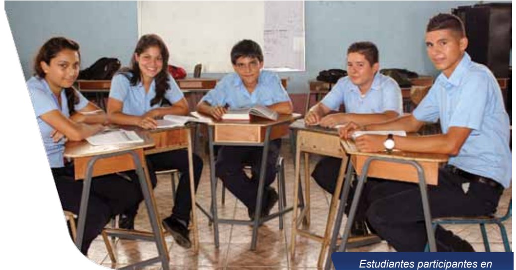
Estudiantes participantes en olimpiadas de matemática.