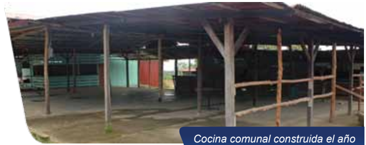
Cocina comunal construida el año anterior.

Esta actividad, además de buenos amigos y mucha diversión, dio como resultado una ganancia de ₡4.600.000 (cuatro millones seiscientos mil colones) que contribuyen al desarrollo de proyectos comunales. En años anteriores los recursos se invirtieron para habilitar una cocina comunal y levantar un galerón para sus actividades; este año, la meta es unir estos fondos junto a otros para hacer realidad el sueño de tener un redondel en el año 2013.