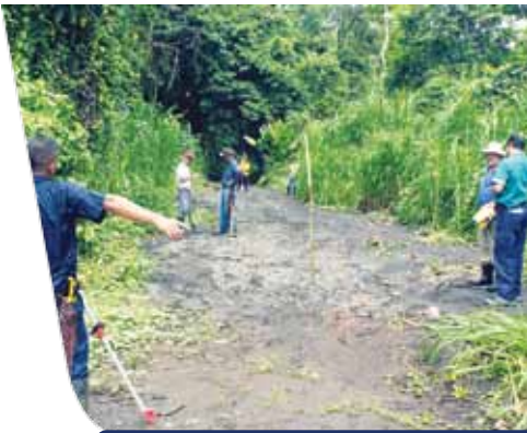
Cuadrilla de Topografía del MOPT realiza mediciones para determinar la mejor ubicación del nuevo puente que unirá Sectores A y B.

Como avance de este proyecto cabe mencionar que en el mes de marzo se recibió la visita de un ingeniero del departamento de Vías del MOPT, quien realizó una inspección del lugar; además, los días 24 y 25 de mayo, un topógrafo del MOPT visitó Cubujuquí con el objetivo de definir el sitio óptimo para la ubicación del puente.